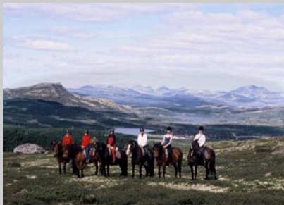
Auf Reittour im Venabygdsfjell mit Rondane im Hintergrund

Alle Hütten mit toller Aussicht zum Gebirge. Die Blockhütten mit Torfdach sind gut ausgestattet mit Fußbodenwärme und gefliestem Bad, Kühlschrank, Kochplatten, Kaffeemaschine, Wasserkocher, Küchenzubehör und Bettdecken im Schlafzimmer. Einige der Hütten haben Spülmaschine, Sauna, Kinderbett und Kinderstuhl. Alle Hütten haben R/ Kabel-TV und Terrasse mit Gartenmöbeln.